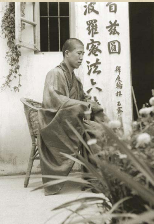
圖：1952年， 上人攝於西樂園寺。

飯後全體參訪西樂園，這是上人初來香港所建設的第一個道場。西樂園位於筲箕灣馬山邨的山脊，山坡尖峭，路徑彎曲，要爬上三百多個石階方可到達。上人堅持和我們一起上山，男女老少一行十餘人，在山間繞了幾個大圈，年紀較大的，都走得氣喘呼呼。見到上人那種剛毅不屈，不厭艱辛也和我們青年人邁進的精神，給