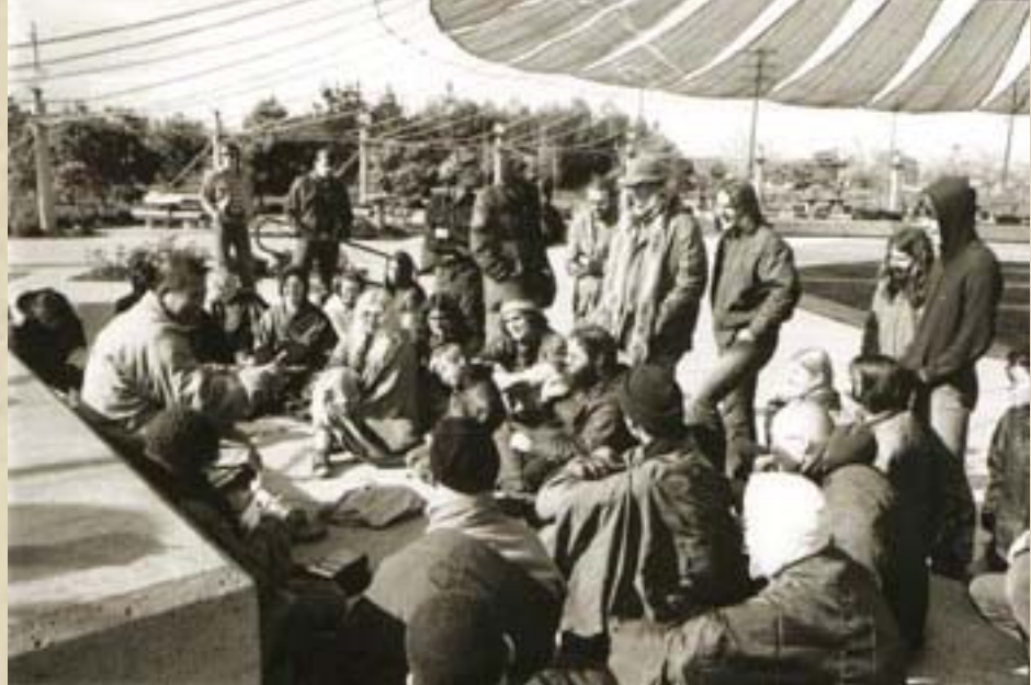
圖：1976年，上人在美國聖他克拉拉（Santa Clara）中央公園（Central Park）為年青的美國人講「和平的精神（Energies for Peace）」。

上人常對我提起美國教育制度裡的弊病。例如在大學裏考試，學生可以打開書本，邊考邊翻書。這是一種公開承認的『作弊』，但美國人不以爲然，覺得這是天公地道的。多年來我爲自己充當辯護律師，總覺得我沒有作弊，爲什麼上人老是對我耳提面命呢？