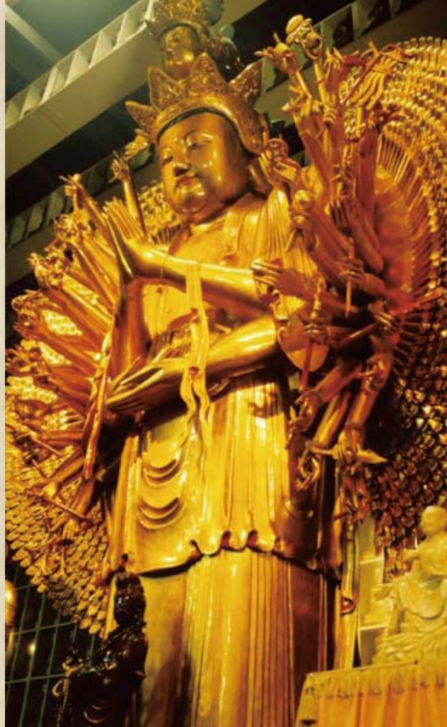
圖：萬佛聖城千手觀音。

三藩市有一位姓卡佛的美籍牙醫，最近與他太太及兩個小孩，皈依三寶，對上人信心堅固。上個星期他們都在家，兩個孩子見到上人親身來訪。門鈴一響，小孩子開了門，目睹上人身穿黃袍披紅祖衣，面露安祥的笑容，赫奕莊嚴。但轉過身來，上人已蹤影全無，在虛空裏消失了。