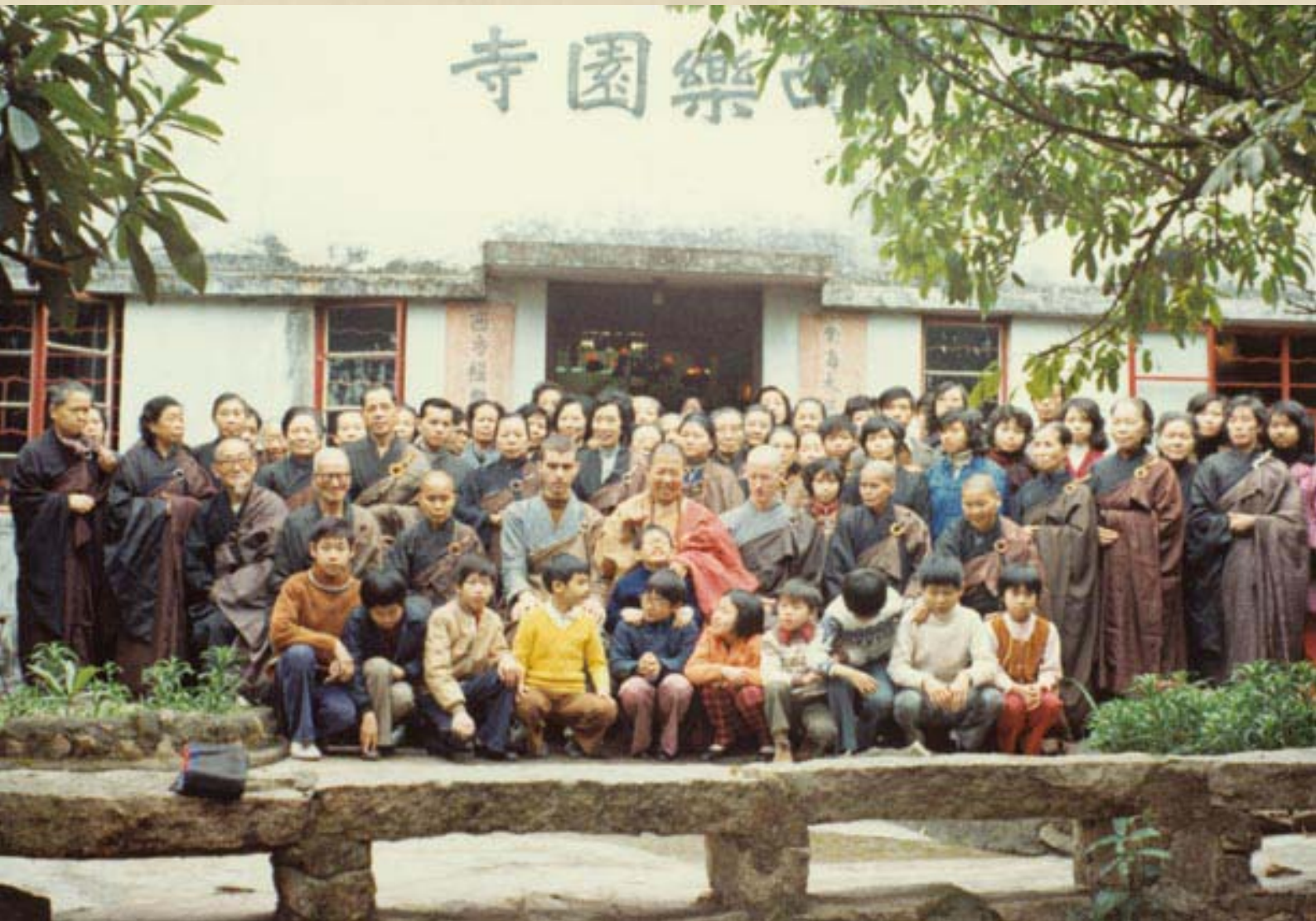
圖：1974年12月， 上人率領弟子香港弘法，與老皈依弟子合影。