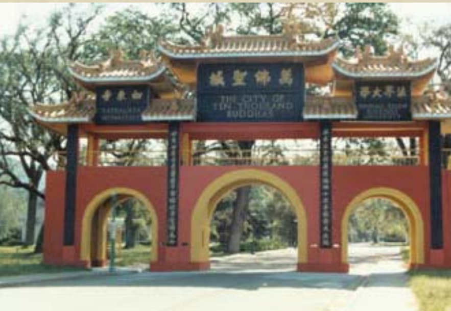
圖：1978年，萬佛聖城紅色山門。