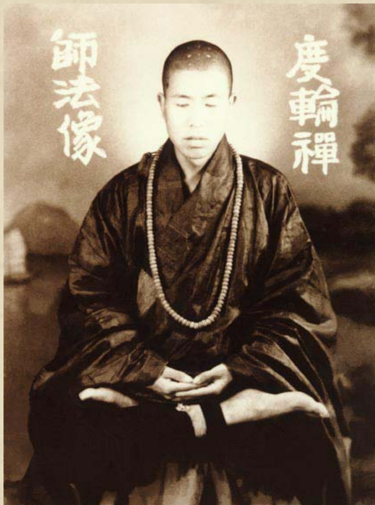
圖：一九五一年，上人攝於西樂園寺

是日已過命光微，如少水魚最堪悲；當勤精進修淨土，如救頭然改過非。 無常忽至誰為主，放逸結果自吃虧；寄望諸賢時警惕，深淵薄冰好自為。