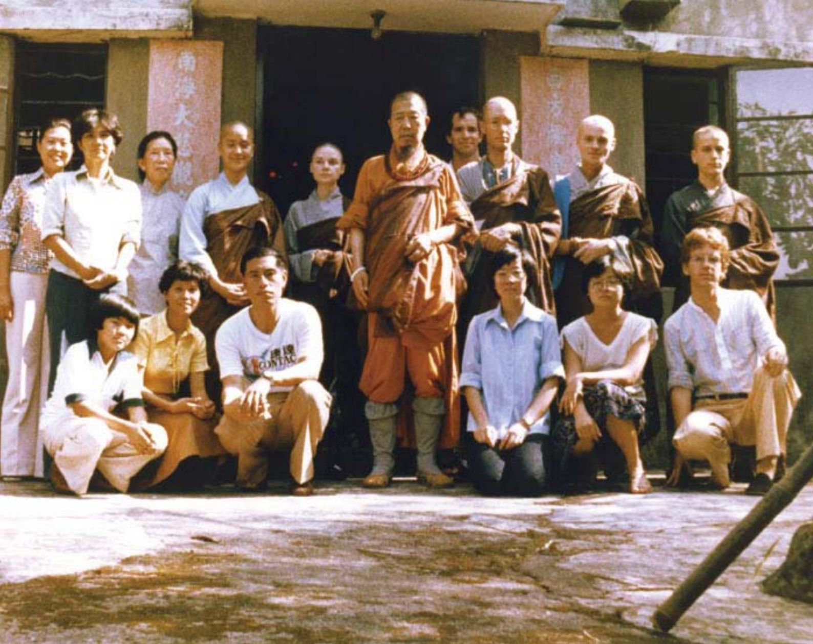
圖：1978年9月18日，訪問團於西樂園寺前留影。